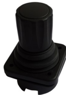
BI-AXEL JOYSTICK X-Y-Z