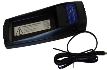
BATTERIJLADER TYPE 434